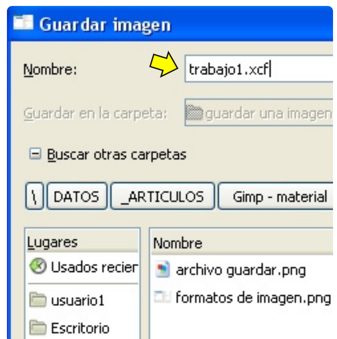
Figura 2. Escribir el nombre del fichero.

Guarda el ejercicio y envíalo al profesor.